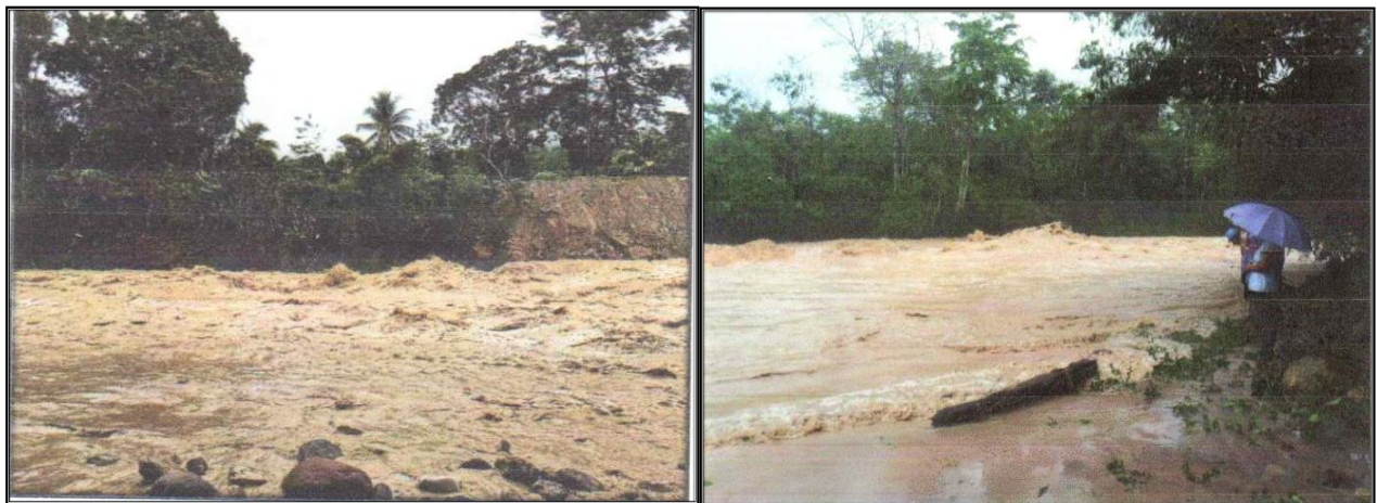
EROSION DE LA RIBERA DEL RIO CUMBAZA