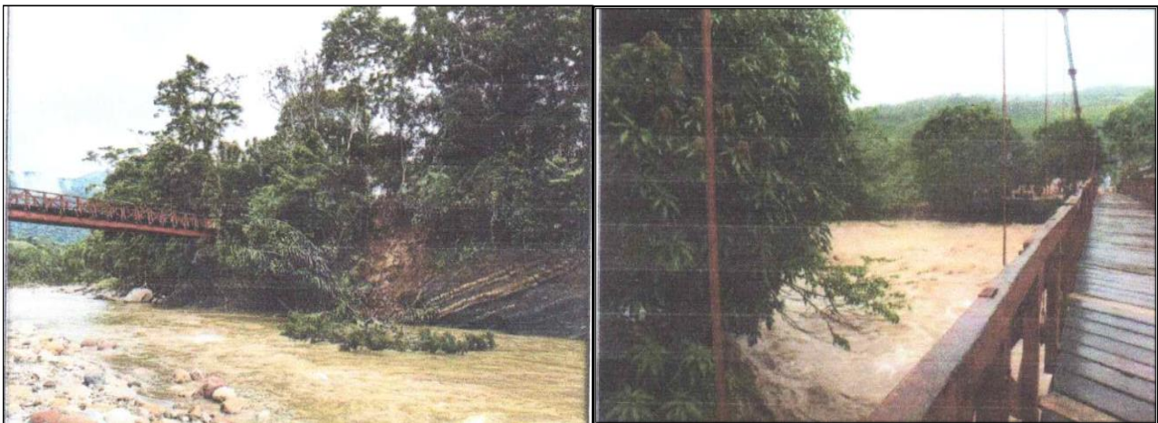
AFECTACION DEL PUENTE CUMBAZA